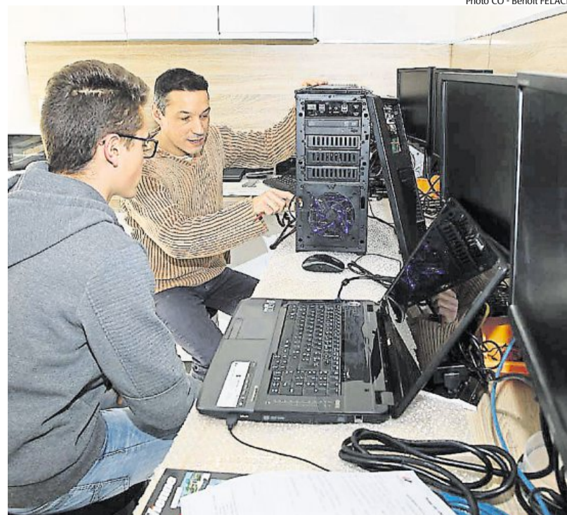
Déploiement informatique, conseil... L'entreprise frontenaysienne Tecodata vend aussi du matériel aux particuliers et peut assurer la maintenance.