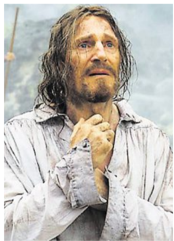
Liam Neeson dans « Silence », à l'affiche au Mega CGR.

« American Honey » : à 17.30. « The Fits » : à 20.30. « Jackie » : à 15.30.